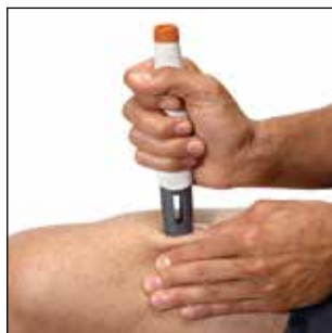
Afbeelding 10: Injectie in de dij

Let op: de voorgevulde pen zal gedurende 10 seconden een klikgeluid maken – afhankelijk van uw dosis. Houd de pen nog 5 seconden tegen de huid om zeker te zijn dat u de volledige dosis krijgt. Let op: zodra de voorgevulde pen wordt weggenomen van de huid, wordt de naaldbeschermer vergrendeld.