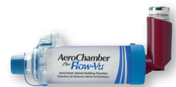
AeroChamber Plus™ met Flow-Vu™ Mondstuk 4+ jaar + Qvar 100 µg