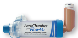
AeroChamber Plus™ met Flow-Vu™ Mondstuk 4+ jaar + Qvar 50 µg