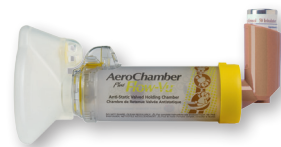
AeroChamber Plus™ met Flow-Vu™ Kindermasker 1-4 jaar + Qvar 50 µg