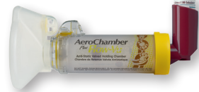
AeroChamber Plus™ met Flow-Vu™ Kindermasker 1-4 jaar + Qvar 100 µg